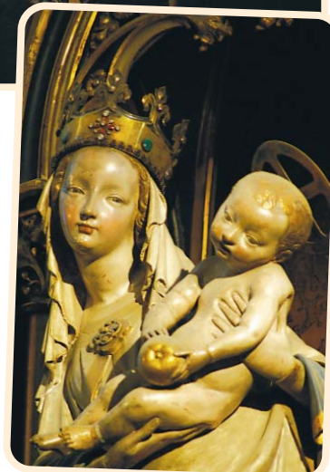
V noci si můžeme prohlédnout i oblíbenou plzeňskou madonu.

Inovaci letošní Noci kostelů bude poutnický pas, na kterém návštěvníci mohou sbírat razítka jednotlivých kostelů, které navštíví během akce. Razítka jsou speciálně vyrobena pro tento účel a znázorňují vždy nějakou architektonickou nebo uměleckou zajímavost, která charakterizuje konkrétní kostel. Účastníkům Noci kostelů bude nabídnuta možnost, aby si na razítko ztvárněný motiv vyhledali uvnitř kostela. Ti, kteří nasbírají razítka všech kostelů, obdrží na plzeňském biskupství jako odměnu certifikát