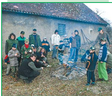
Při hledání jara všem vyhládo.

Tradiční akce s názvem „Hledání jara“ oslovila na Rokycansku dospělé i děti. Rokycanští ochránci přírody společně pátrali po projevech jara a navíc udělali něco pro přírodu. Pátrali po kvetoucí prvosence, zjišťovali, zda již lze pozorovat ještěrku či vyskytuje-li se někde na malém potůčku mlýnek poháněný vodou. I když bylo poměrně těžké splnit poslední úkol, tedy najít mlýnek na potoce, nakonec se to rokycanským ochráncům přírody podařilo a objevili jej v chatové oblasti Zbirožského potoka. Splněním, respektive nálezem všech tří projevů jara tak dokázali, že jaro již na Rokycansko skutečně dorazilo.