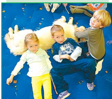
Děti v Mateřské škole Stromořadí

Dobřany patří s věkovým průměrem 37 let k nejmladším městům v kraji. A tak není divu, že je tam velký zájem o předškolní zařízení. Kapacita dvou mateřinek nestačila, proto loni město zřídilo v jedné ze školek další třídu pro dvacet dětí. Míst je tak 260, což už by prý mohlo uspokojit potřeby obyvatel města. V Plzeňském kraji je celkem 250 mateřských škol.